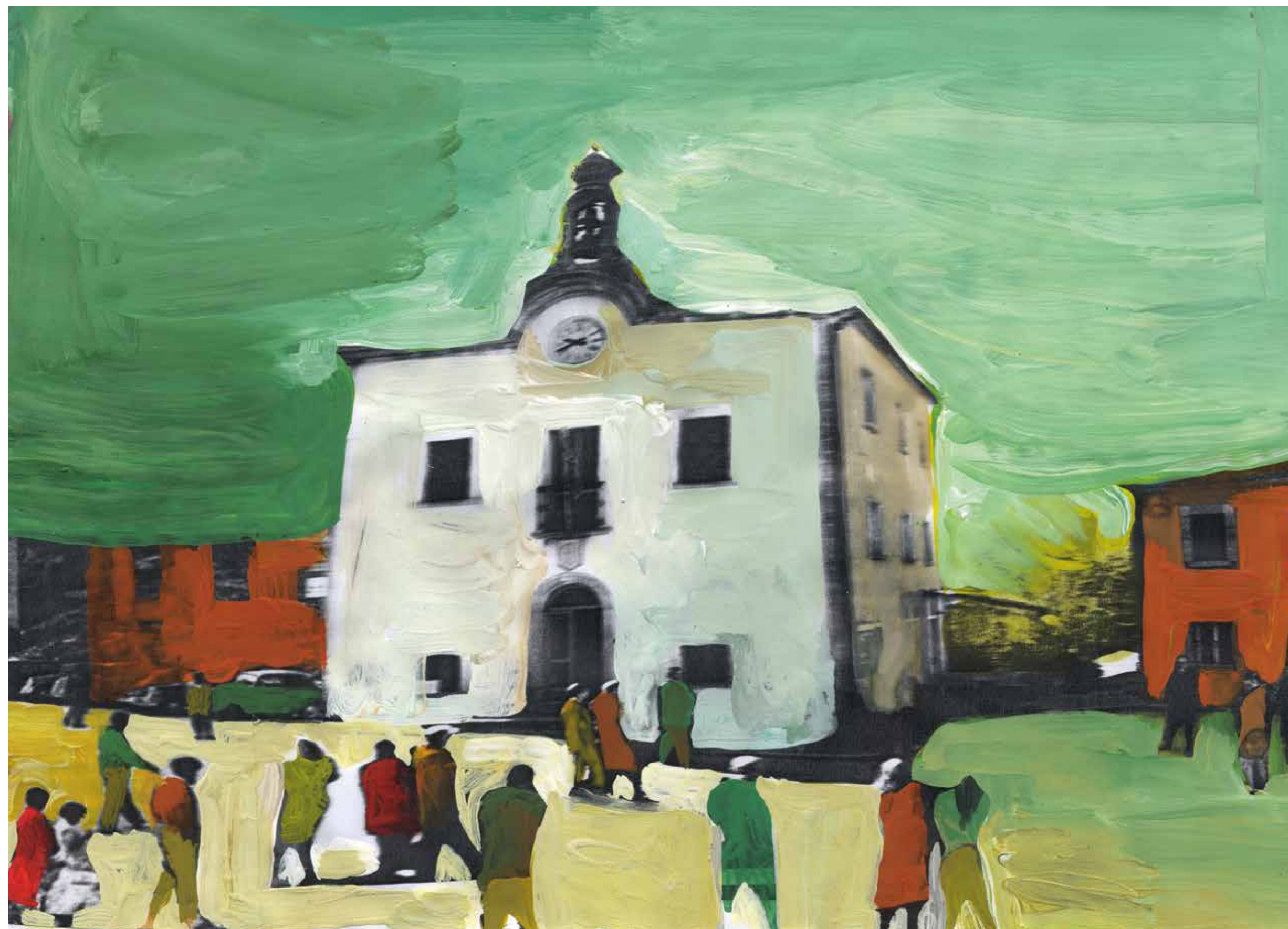
Gianluigi Toccafondo, Faetano , 2015, acrilici su carta