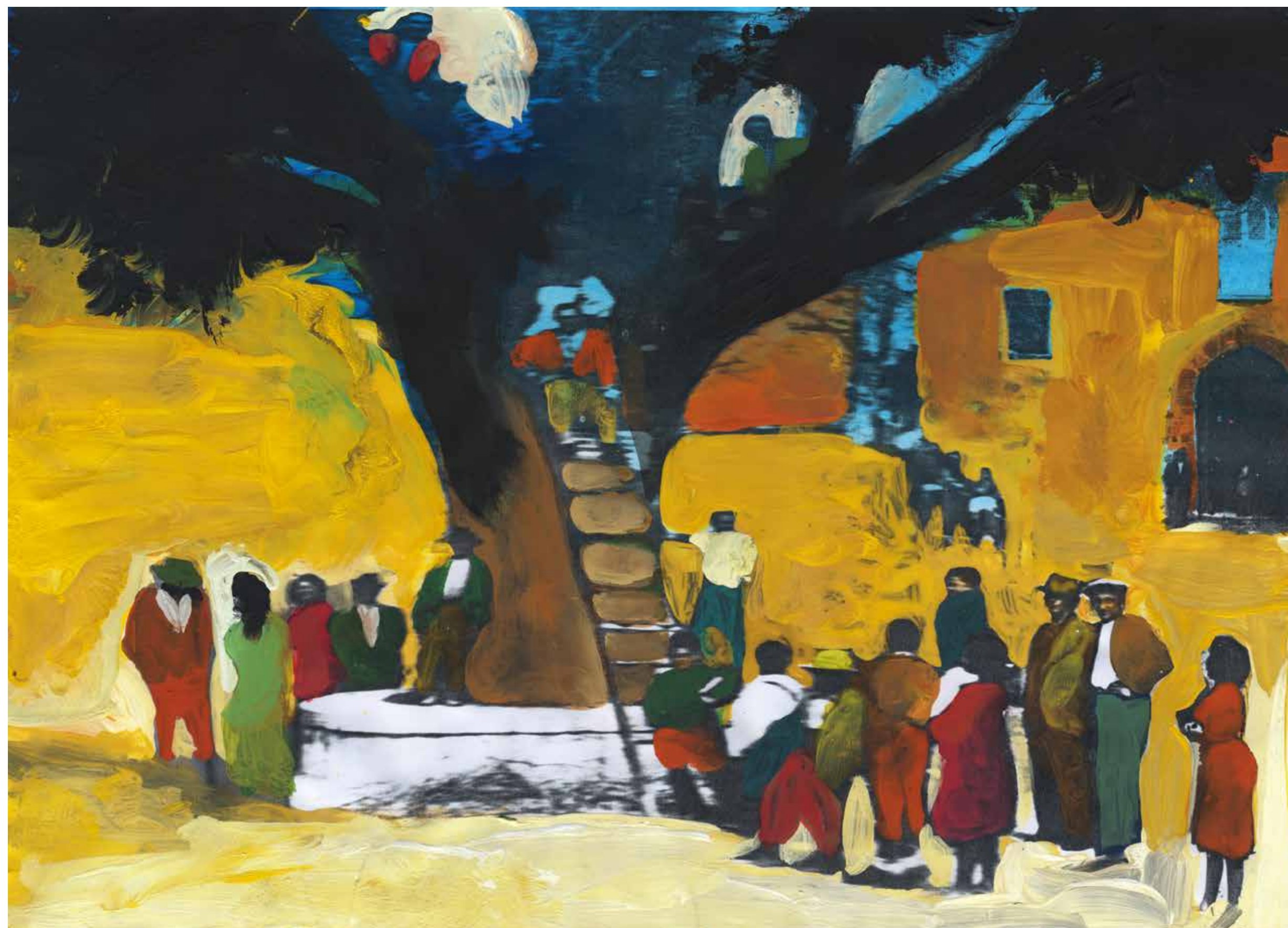
Gianluigi Toccafondo, Montegiardino , 2015, acrilici su carta