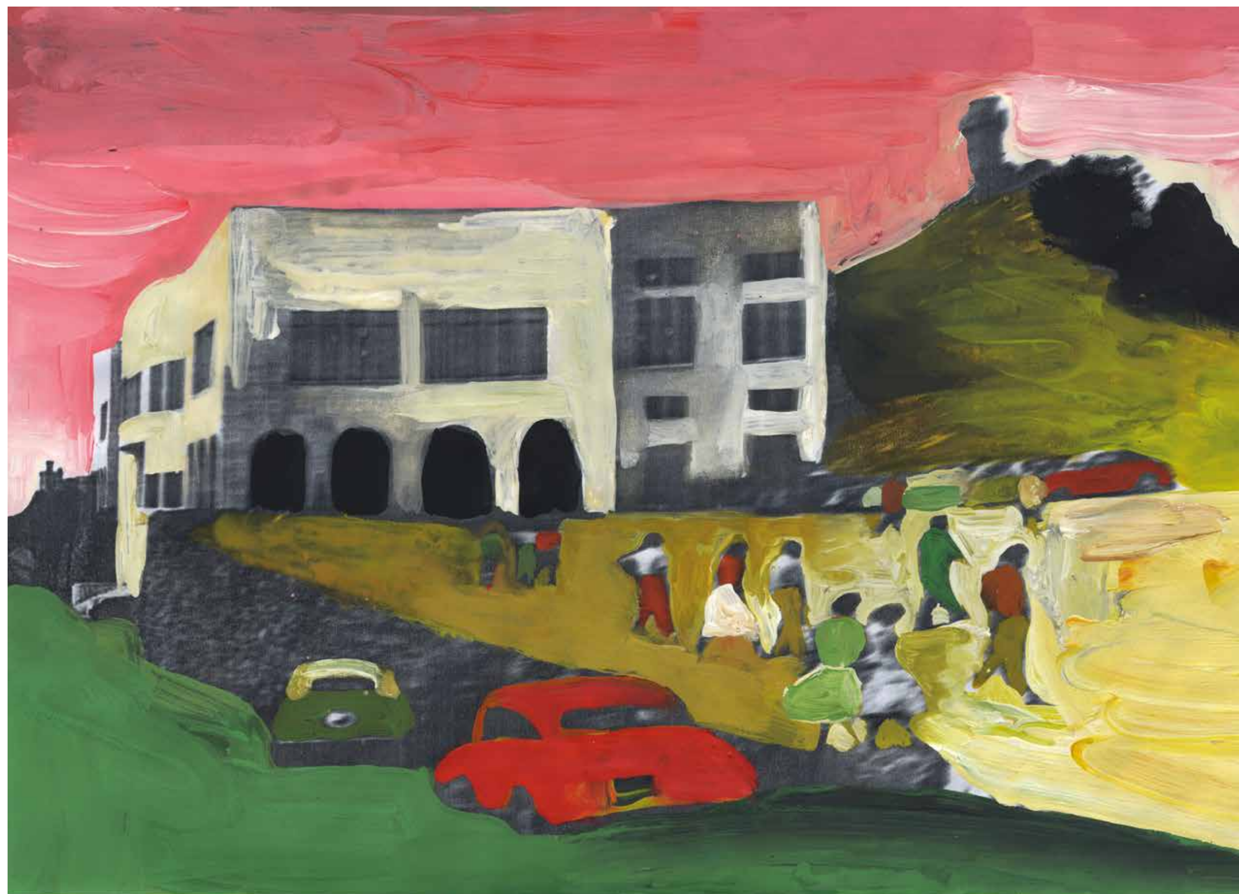
Gianluigi Toccafondo, Città , 2015, acrilici su carta