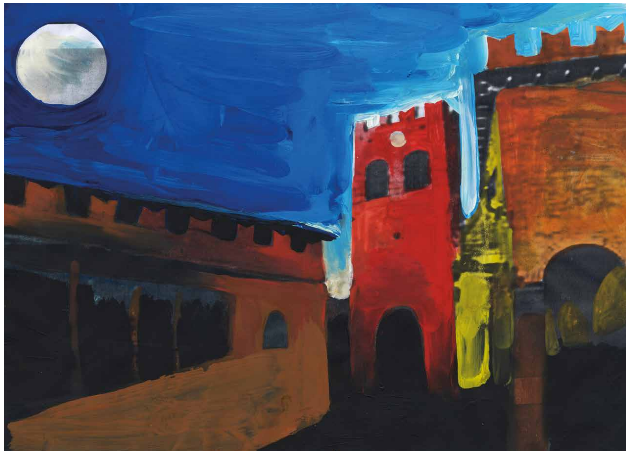
Gianluigi Toccafondo, Serravalle , 2015, acrilici su carta