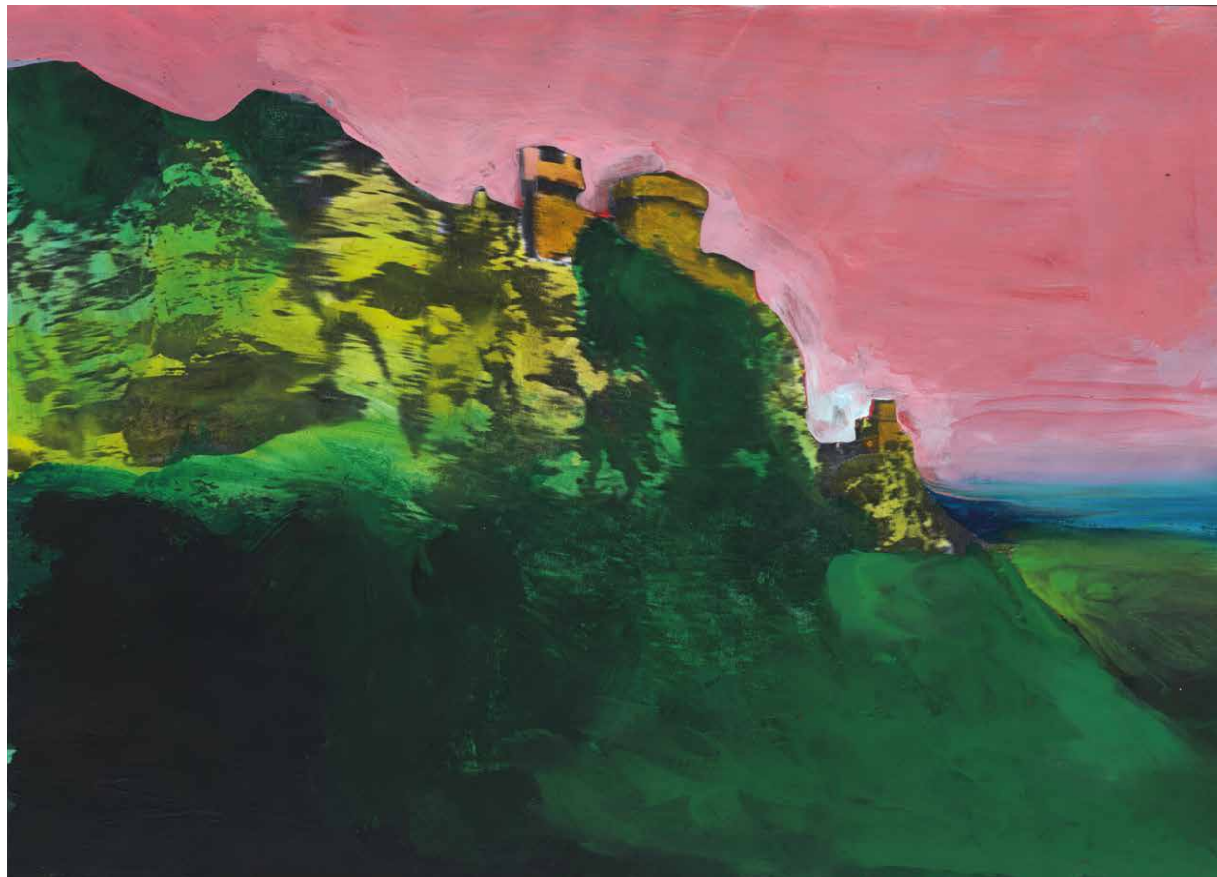
Gianluigi Toccafondo, Rocca , 2015, acrilici su carta