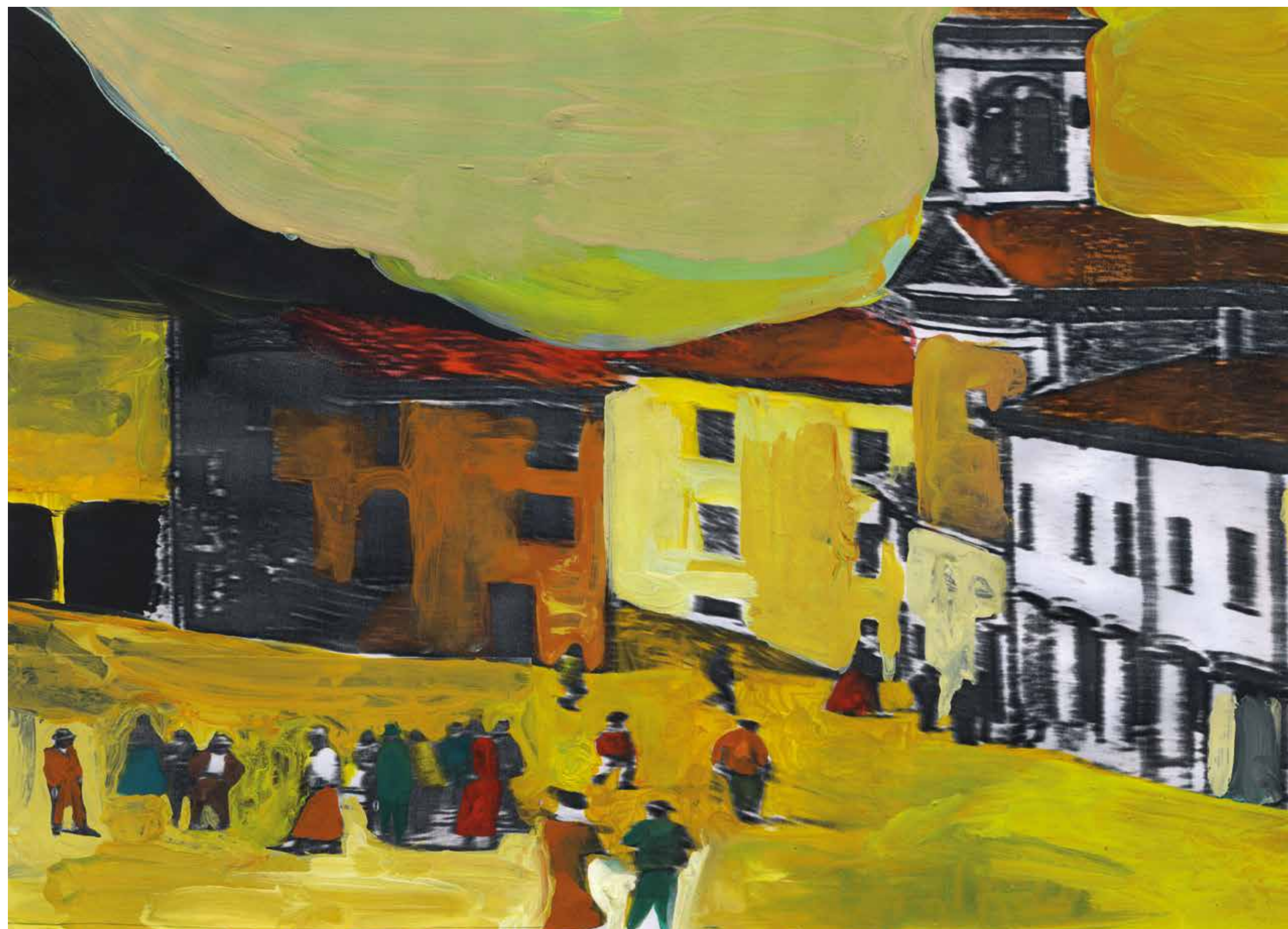
Gianluigi Toccafondo, Borgo , 2015, acrilici su carta