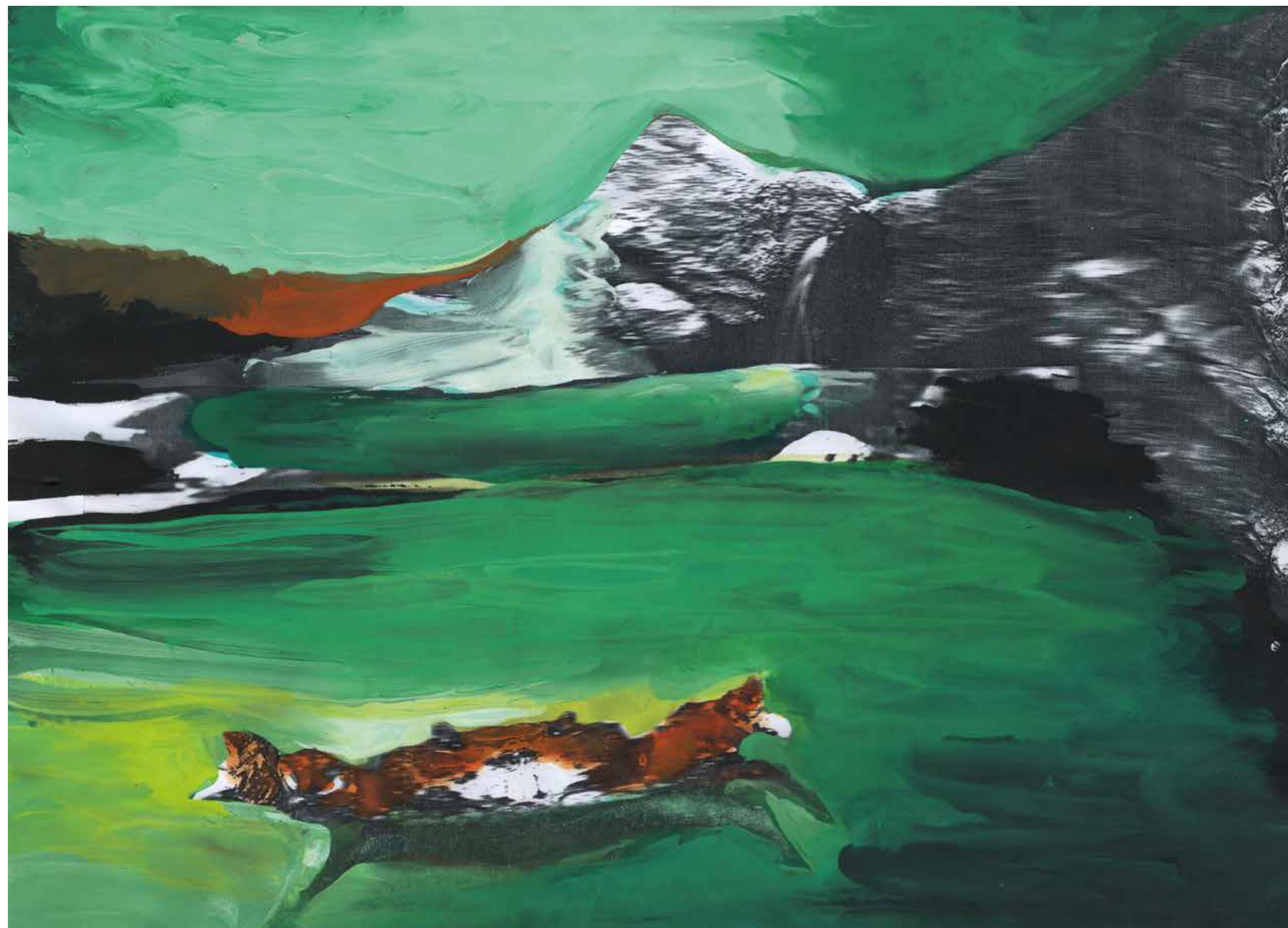
Gianluigi Toccafondo, Chiesanuova , 2015, acrilici su carta