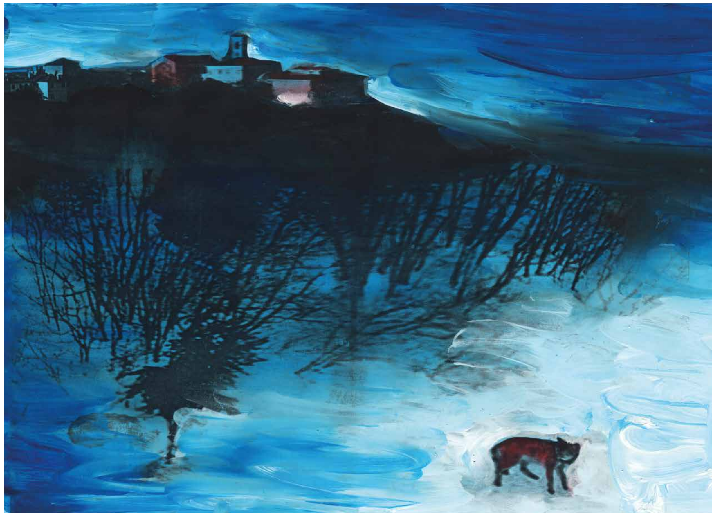
Gianluigi Toccafondo, Domagnano , 2015, acrilici su carta