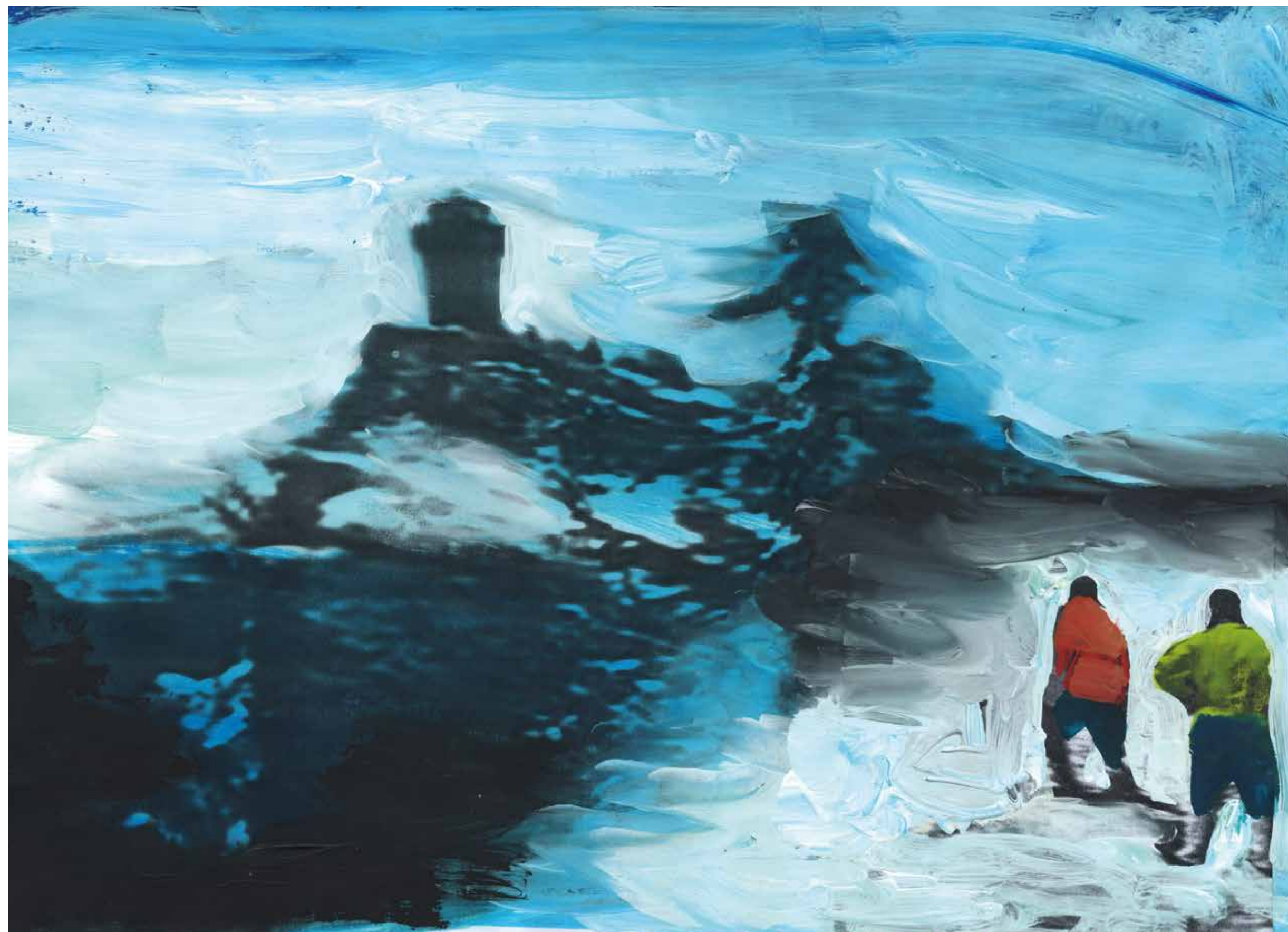
Gianluigi Toccafondo, Nevicata , 2015, acrilici su carta