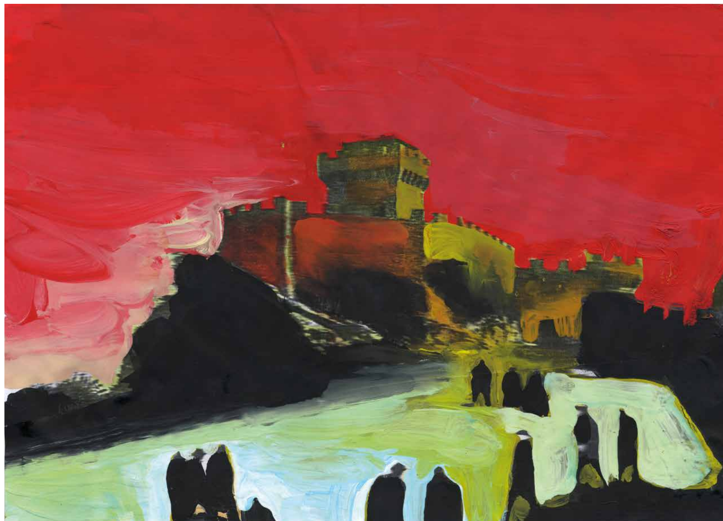
Gianluigi Toccafondo, San Marino , 2015, acrilici su carta