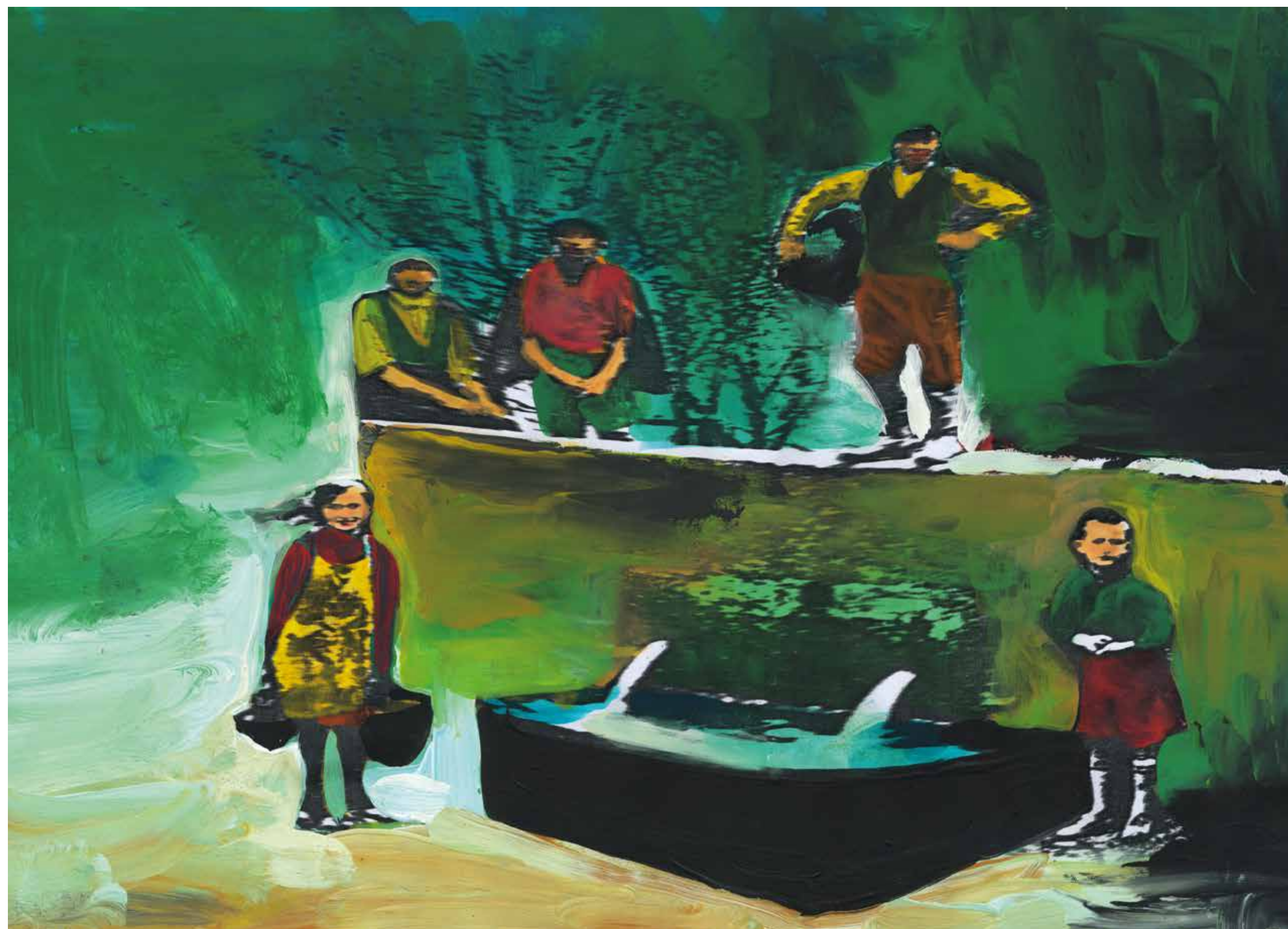
Gianluigi Toccafondo, Acquaviva , 2015, acrilici su carta