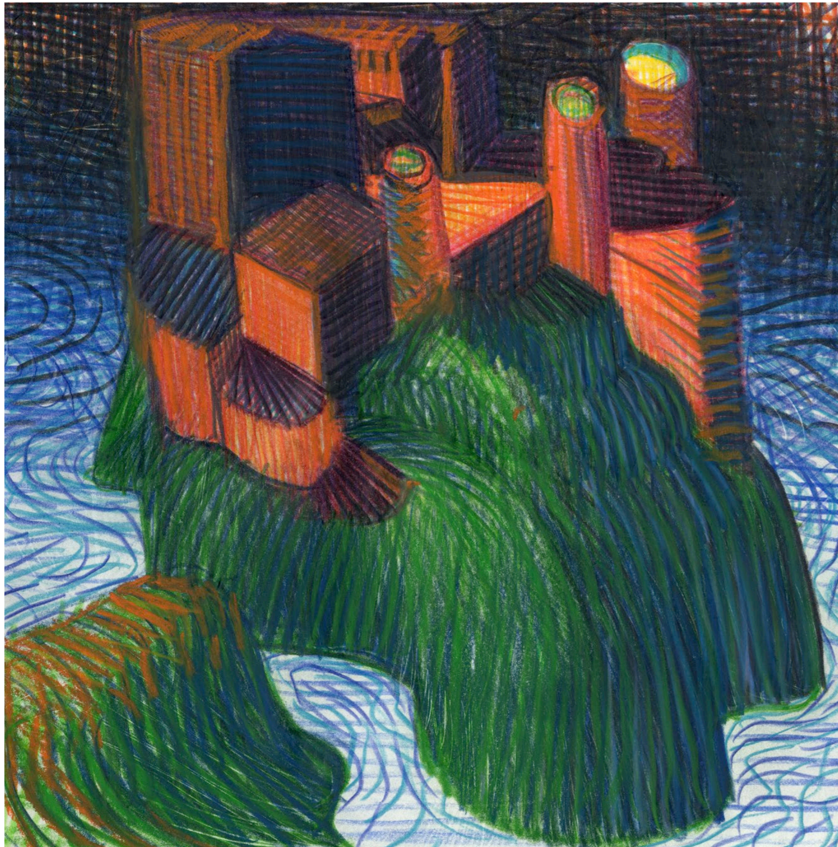
Lorenzo Mattotti | Castelli Immaginari | Matite colorate e pastelli su carta, 2016