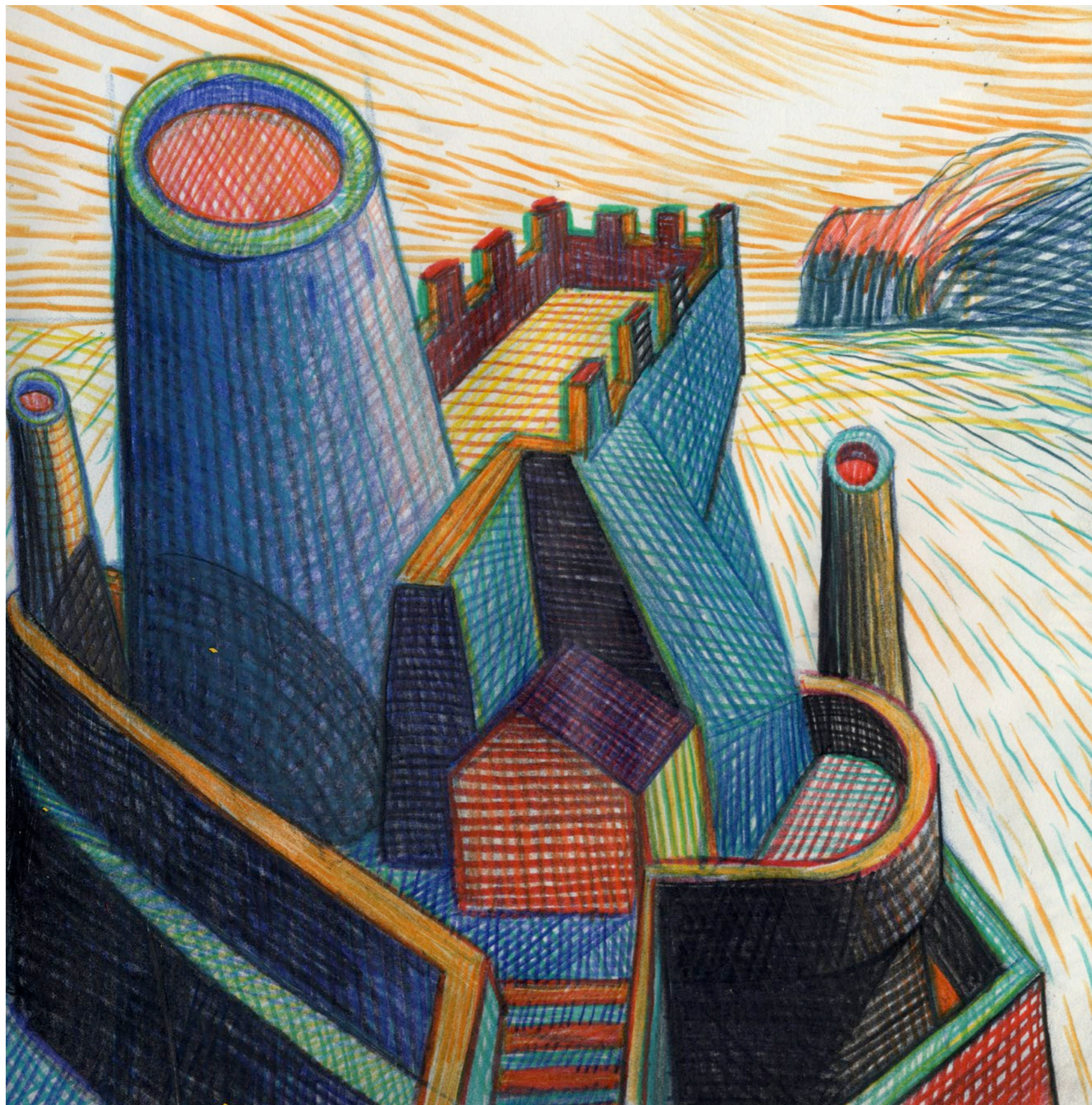
Lorenzo Mattotti | Castelli Immaginari | Matite colorate e pastelli su carta, 2016