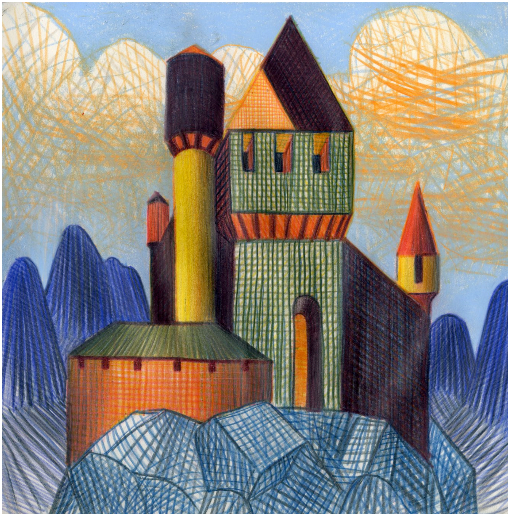
Lorenzo Mattotti | Castelli Immaginari | Matite colorate e pastelli su carta, 2016