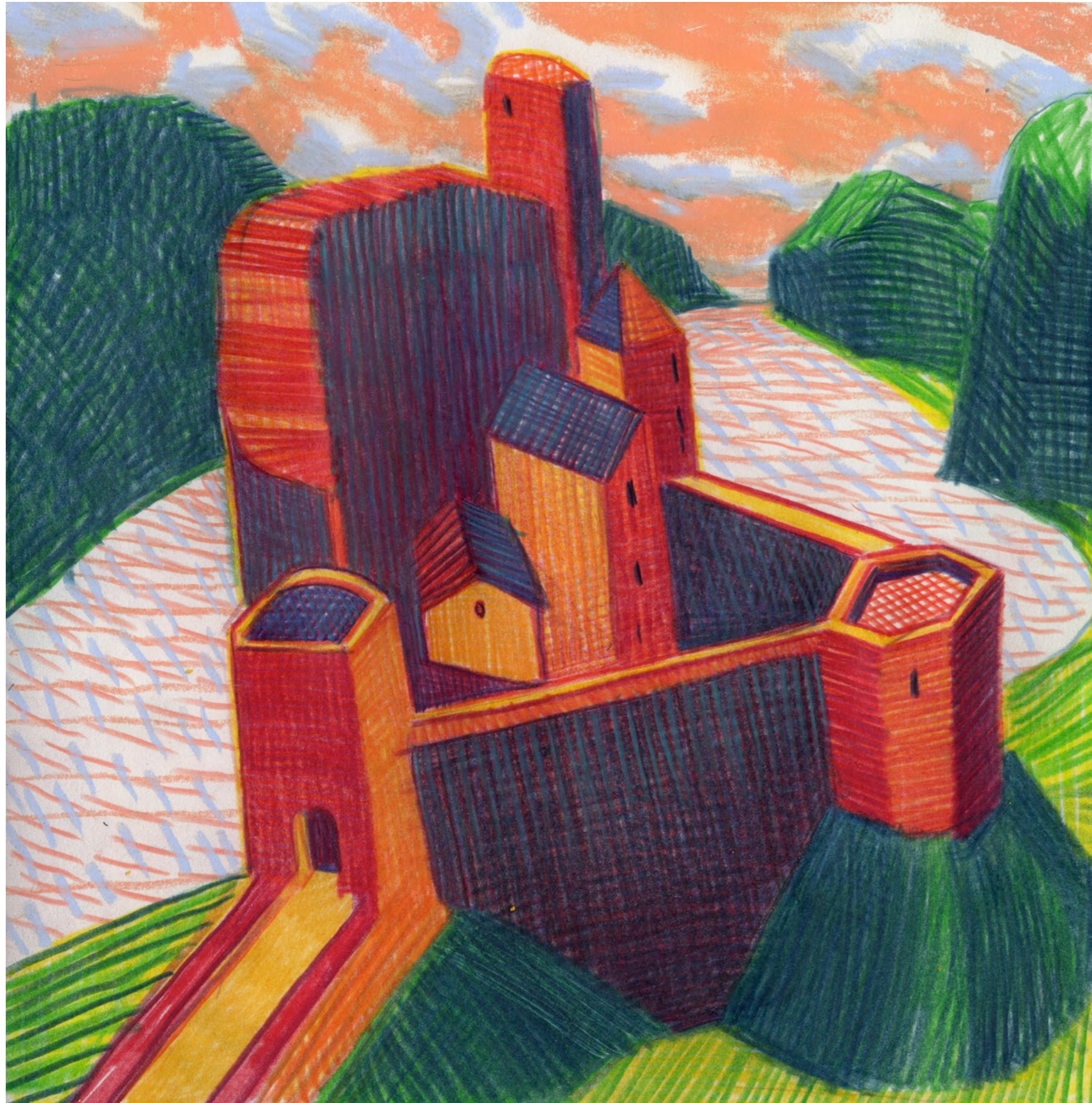
Lorenzo Mattotti | Castelli Immaginari | Matite colorate e pastelli su carta, 2016