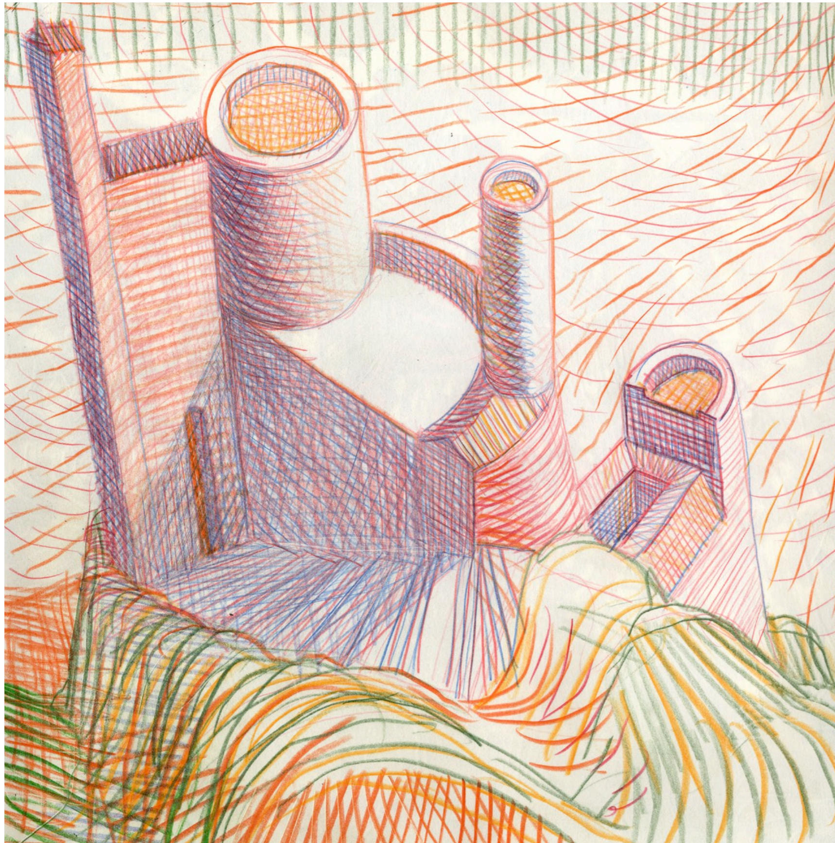
Lorenzo Mattotti | Castelli Immaginari | Matite colorate e pastelli su carta, 2016