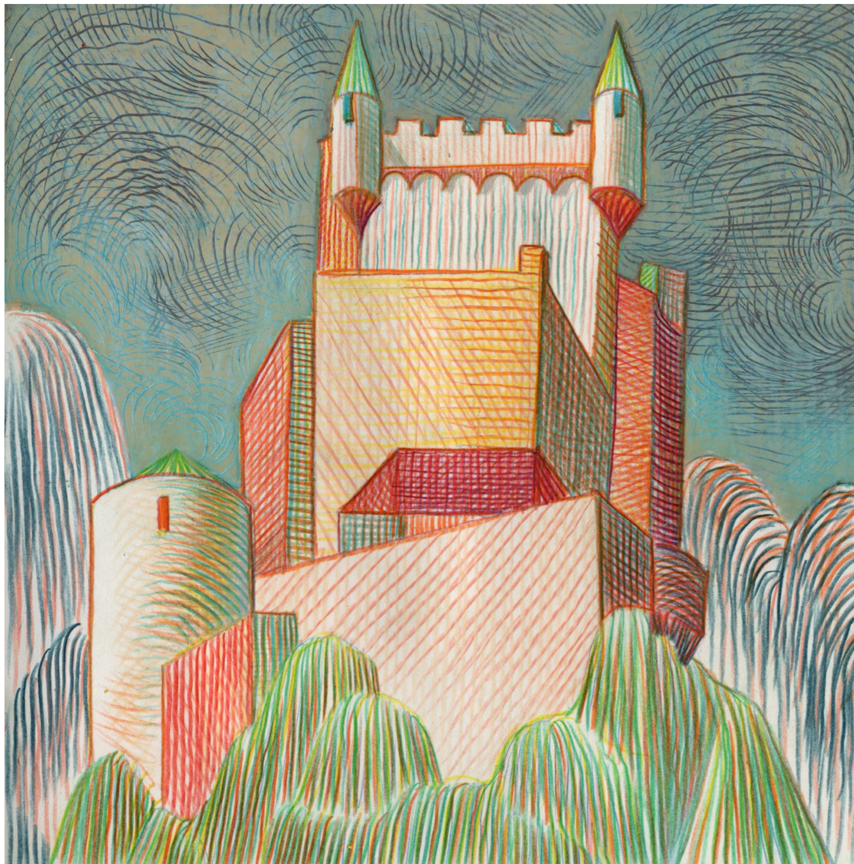
Lorenzo Mattotti | Castelli Immaginari | Matite colorate e pastelli su carta, 2016