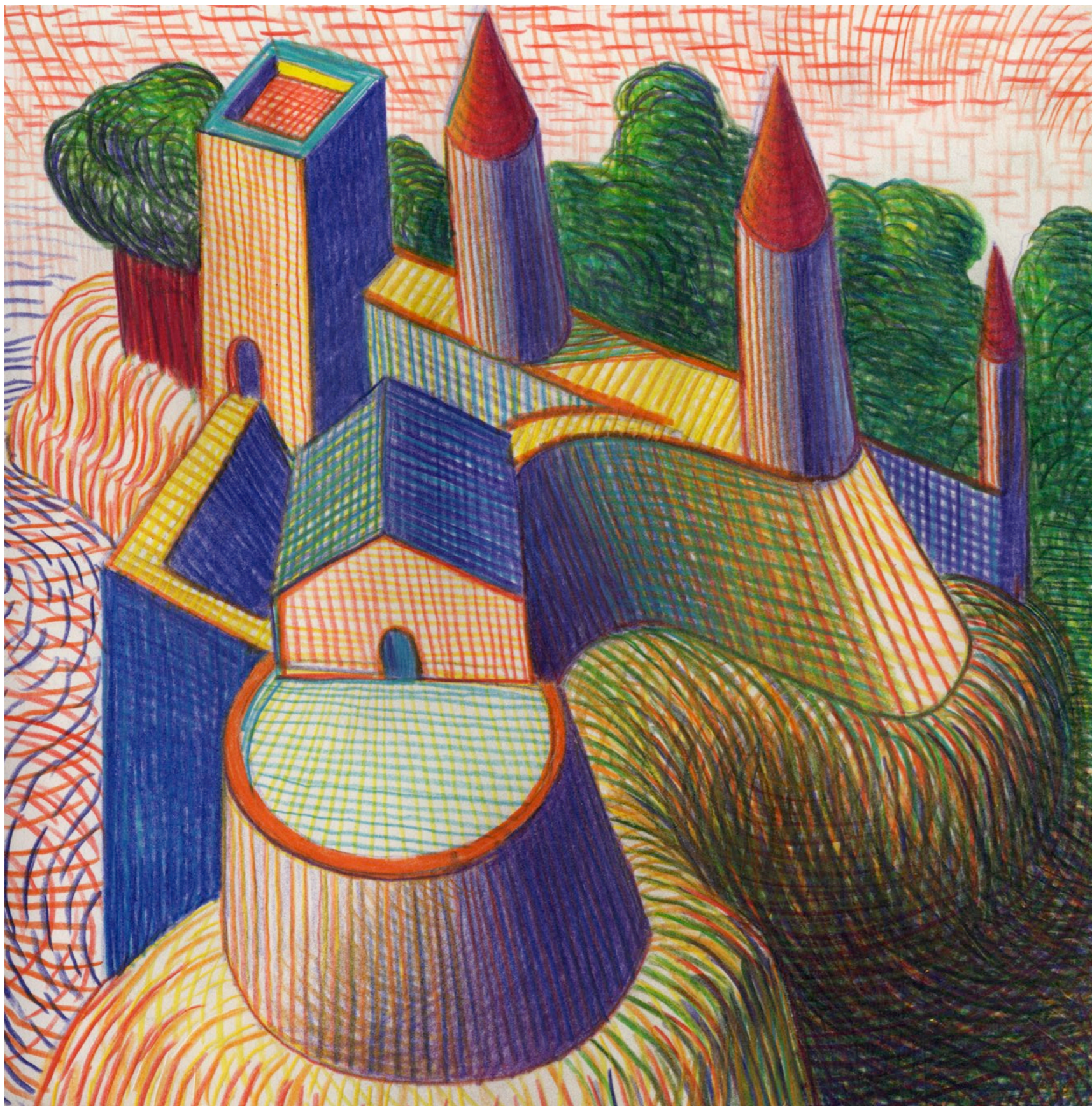
Lorenzo Mattotti | Castelli Immaginari | Matite colorate e pastelli su carta, 2016