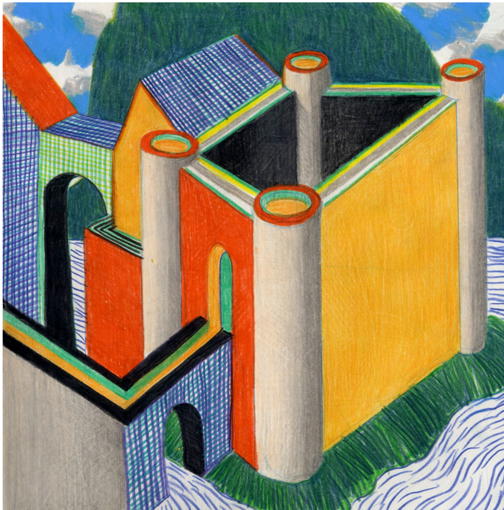
Lorenzo Mattotti | Castelli Immaginari | Matite colorate e pastelli su carta, 2016