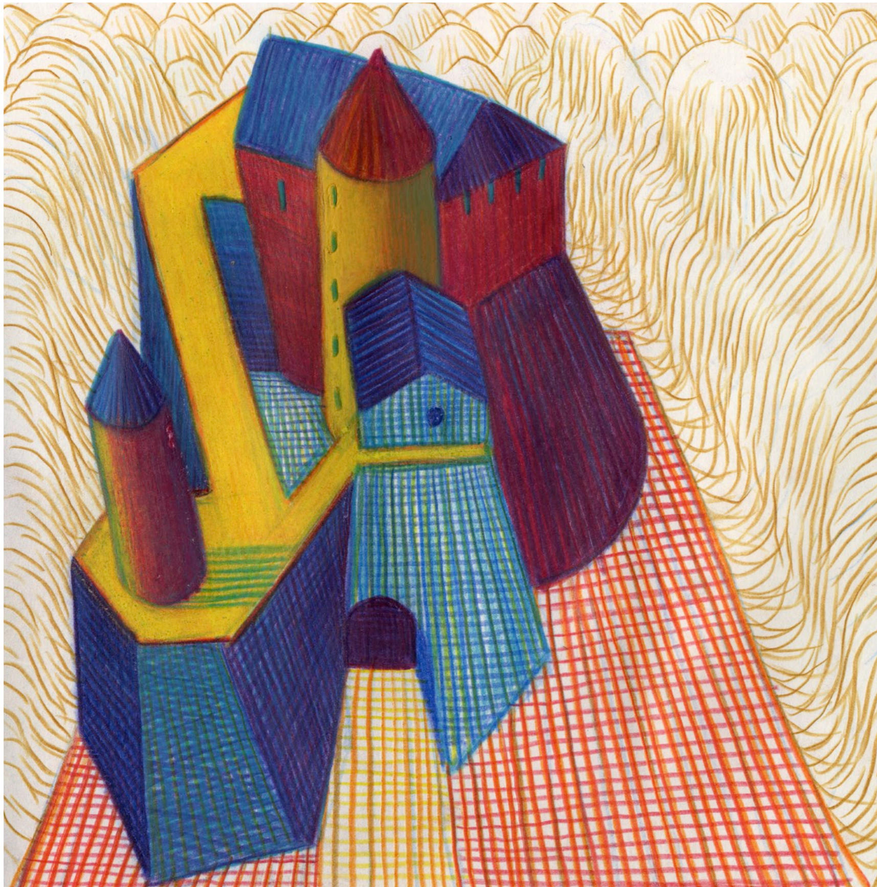
Lorenzo Mattotti | Castelli Immaginari | Matite colorate e pastelli su carta, 2016