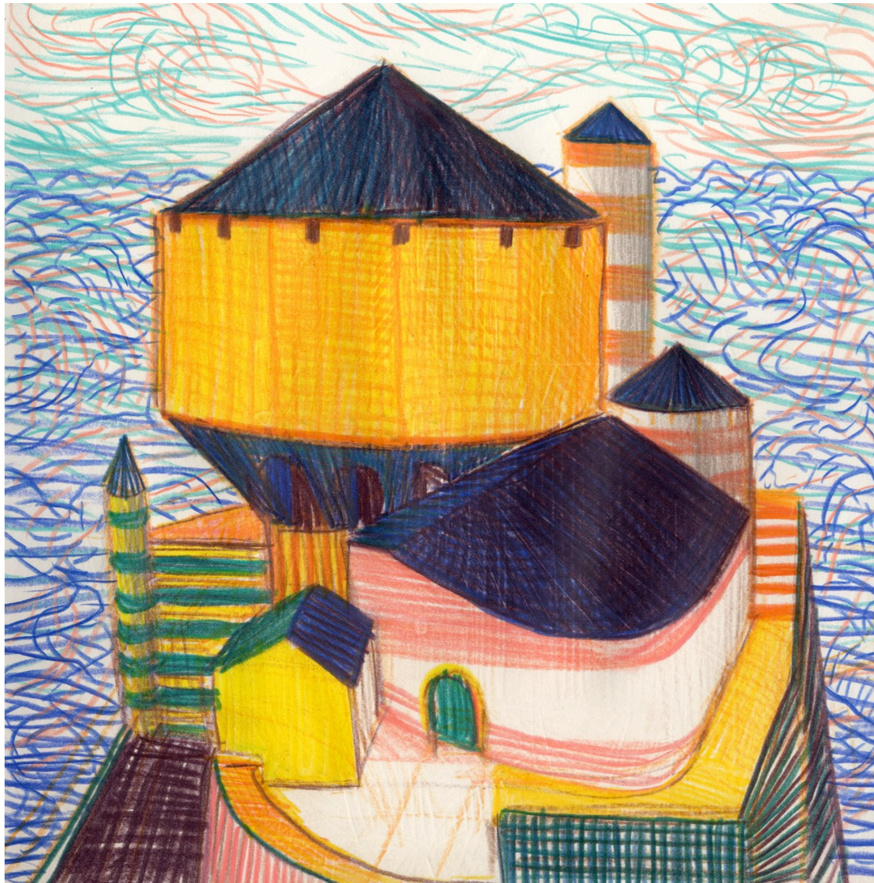
Lorenzo Mattotti | Castelli Immaginari | Matite colorate e pastelli su carta, 2016