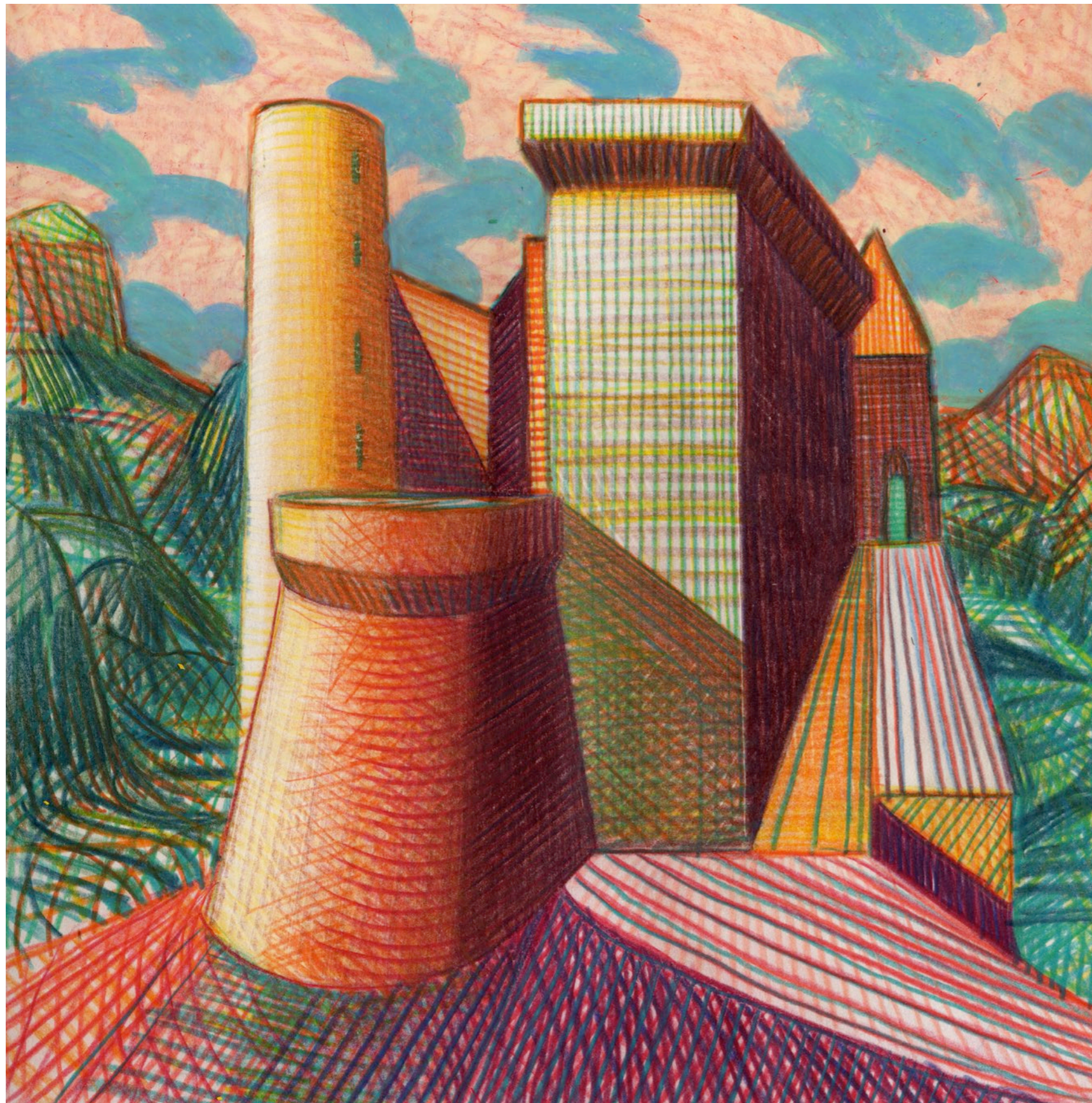
Lorenzo Mattotti | Castelli Immaginari | Matite colorate e pastelli su carta, 2016