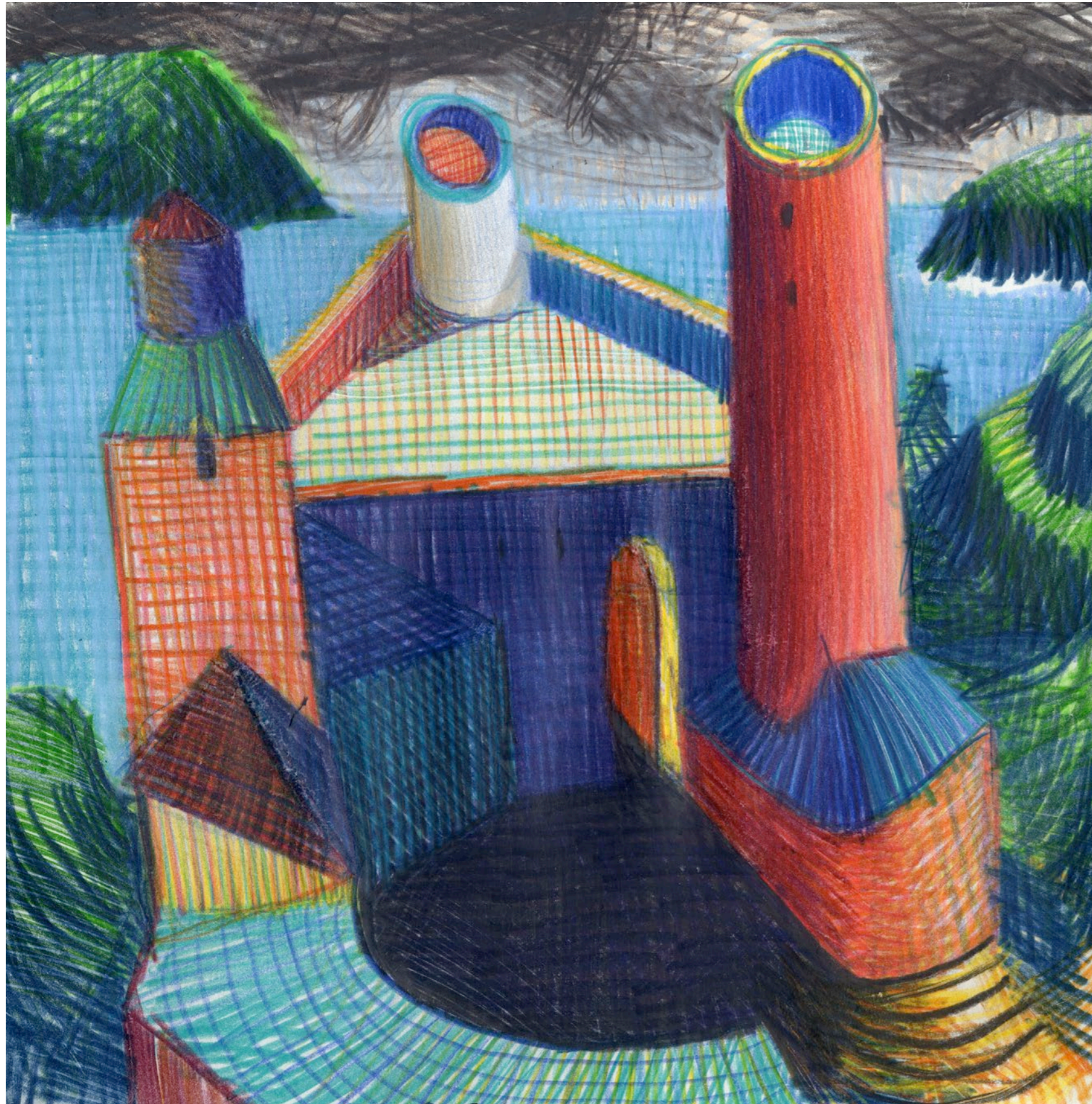
Lorenzo Mattotti | Castelli Immaginari | Matite colorate e pastelli su carta, 2016